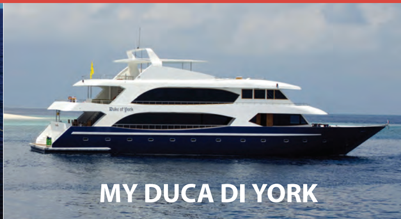
MY DUCA DI YORK

Le sistemazioni a bordo delle nostre barche (motor yacht di categoria superior – lusso) è prevista in cabine dotate di servizi privati, e aria condizionata. Trattamento di pensione completa con cucina italiana ed internazionale a base di pesce fresco e spaghettoni. A bordo sarete ospiti esclusivi accolti secondo i cliché della proverbiale cordialità dello staff Albatros Top Boat.