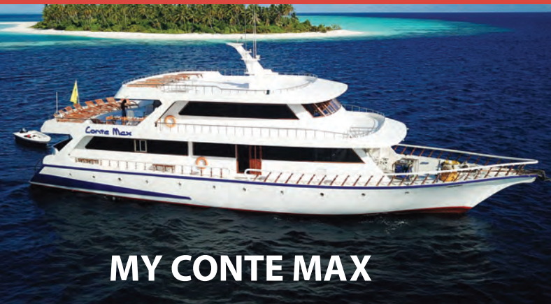
MY CONTE MAX